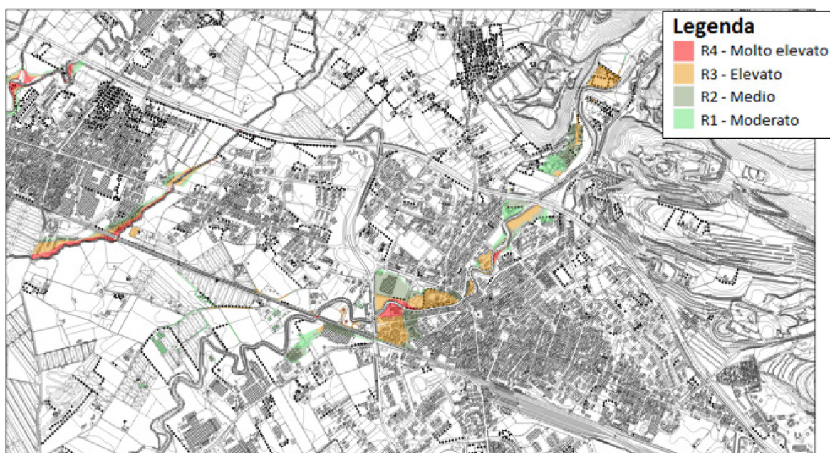
Comune di Battipaglia (SA) – fiume Tusciano – Piano Stralcio di Assetto idrogeologico dell'ex Autorità di bacino regionale Destra Sele – Stralcio mappa del Rischio Idraulico approvata (tavv. I_RIS_467161 – I_RIS_467162 – I_RIS_467163)