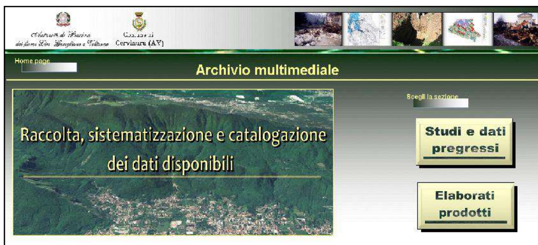
Schermata di interfaccia iniziale con l'Archivio multimediale

Si riporta di seguito l'immagine dell'interfaccia iniziale dell'archivio, nella quale è possibile visualizzare i pulsanti di azione che consentono l'accesso alle due sezioni.