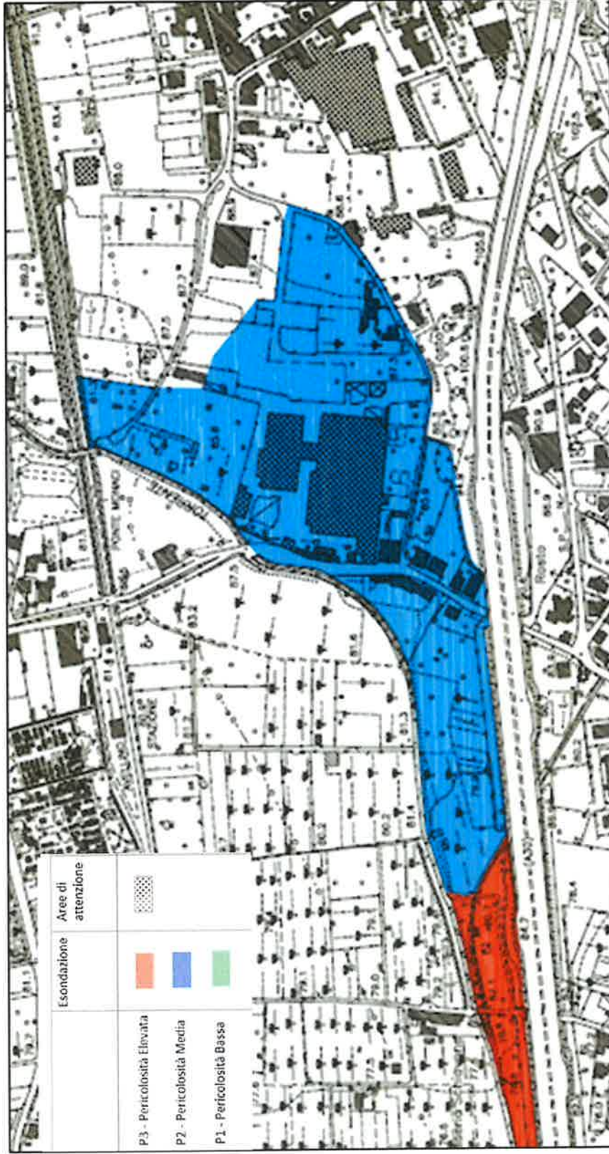
Comune di Mercato San Severino – T. Solofrana - Piano Stralcio di Assetto idrogeologico dell'ex AdB Campania Centrale –Stralcio mappa della pericolosità idraulica approvata (tav.467013 P);